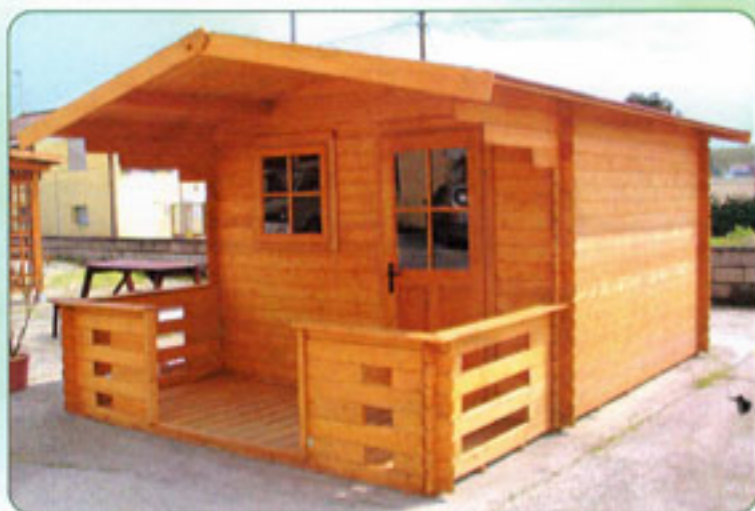
Veranda anteriore 1500 mm, Graticola 19 mm

GL28 - 2020-15...4040a/b GL40 - 2525-15...4040a/b